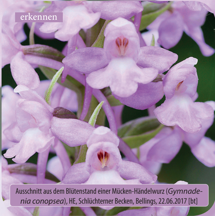
Ausschnitt aus dem Blütenstand einer Mücken-Händelwurz ( Gymnadenia conopsea), HE, Schlüchterner Becken, Bellings, 22.06.2017