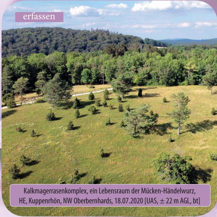
Kalkmagerrasenkomplex, ein Lebensraum der Mücken-Händelwurz, HE, Kuppenhön, NW Oberbernhards, 18.07.2020 [UAS, ± 22 m AGL, bt]