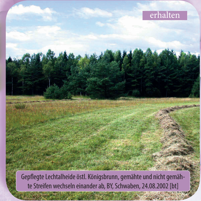
Gepflegte Lechtalheide östl. Königsbrunn, gemähte und nicht gemähte Streifen wechseln einander ab, BY, Schwaben, 24.08.2002