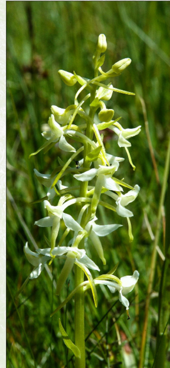
Zweiblättrige Waldhyazinthe Platanthera bifolia (L.) RICH.