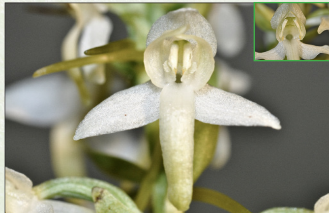
Einzelblüte Platanthera bifolia [kleines Foto: P. chlorantha ]

P. chlorantha : weit auseinander, trapezförmig angeordnet