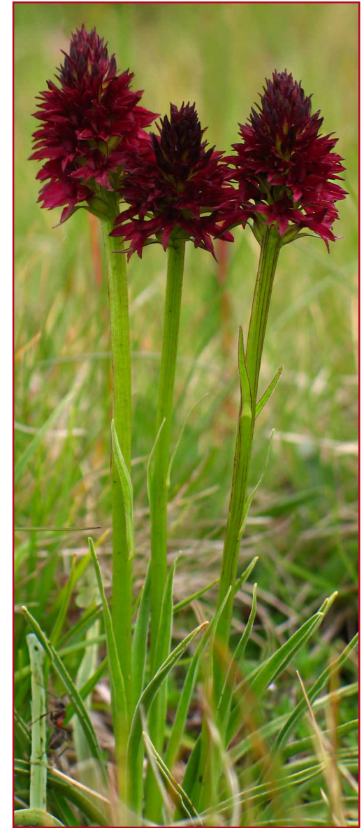
Schwarzes Kohlröschen Nigritella nigra ssp.rhellicani