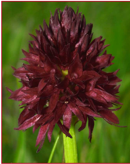
Blütenstand von Nigritella nigra ssp. rhellicani

Das Schwarze Kohlröschen als ihr bekanntester Vertreter repräsentiert die kleine Gruppe der Berg-Orchideen. Mit seiner Wahl zur Orchidee des Jahres 2007 durch die Arbeitskreise Heimische Orchideen in Deutschland (AHO) soll auf die Problematik des Schutzes und der Erhaltung alpiner Lebensräume hingewiesen werden.