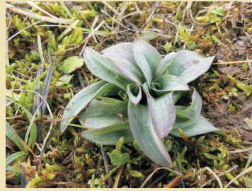
Winterblätter im Januar

Das Dreizählige Knabenkraut entwickelt im Spätherbst aus zwei kugelig bis eiförmigen, unterirdischen Knollen eine Winterblattrosette mit 5-8 bläulichgrünen, ungefleckten Grundblättern. Mit diesen assimilieren die Pflanzen im Winter. Dieses besondere Verhalten, welches auch für die heimischen Ragwurz-Arten gilt, weist darauf hin, dass die Art ursprünglich in Gegenden mit milden Wintern vorkam. Geringe Schneeaufgaben und vor allem Kahlfröste schwächen die Pflanzen, was wiederum Auswirkungen auf die Blühfähigkeit haben kann.