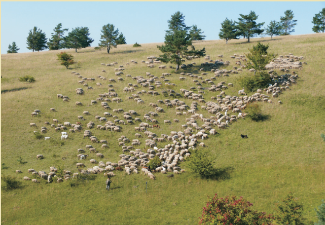
Durch Herbstbeweidung kann die Art gefördert werden.

Langjährige Erfahrungen aus Thüringen und Hessen belegen, dass sich mit einer auf die Blühphase und Samenbildung abgestimmten Schafbeweidung in Form konkreter Beweidungspläne, aber auch durch Mahd noch vorhandene Vorkommen gut regenerieren lassen. Dabei ist eine lockere Vegetationsstruktur mit einer kurzrasigen Grasnarbe anzustreben. Zu berücksichtigen ist auch die Winterblattbildung, d.h. keine Schafbeweidung ab November. Der Tritt der Schafe ist für die Ausbreitung wichtig, wobei die Beweidung relativ kurz aber intensiv oder mit einer lockeren Bestandsdichte erfolgen sollte. Eine Ausbreitung in der Fläche ist ebenfalls möglich, wenn sich im näheren Umfeld wiederbesiedelbare und gepflegte Biotope befinden - ein Beispiel, dass die Art auch durch Biotopverbund gefördert werden kann.