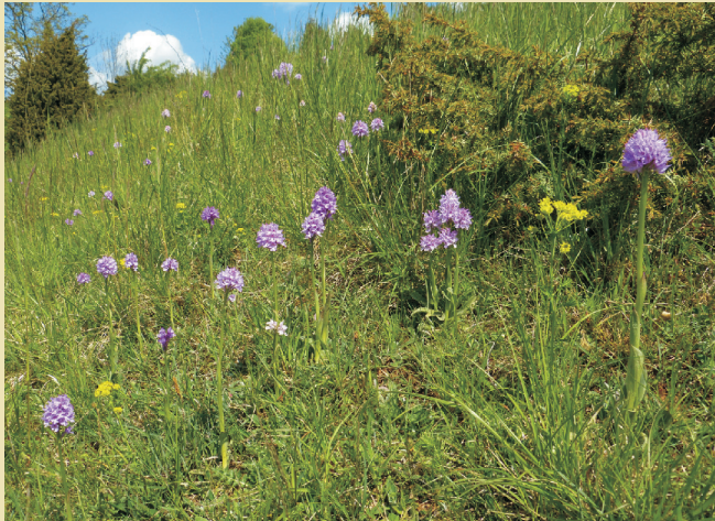
Typisches Biotop: Kalkmagerrasen mit Wacholdergebüsch über Zechstein

Mit der Orchidee des Jahres 2019, auch unter der ursprünglichen Artbezeichnung Orchis tridentata SCOP., 1772 bekannt, wollen die Arbeitskreise Heimische Orchideen Deutschlands auf eine Art aufmerksam machen, welche innerhalb der Bundesrepublik Deutschland nur inselartig verbreitet ist. Neben einem kleinen Teilgebiet an der Oder erstreckt sich das Hauptareal von Ostwestfalen über das südliche Niedersachsen, Nordhessen und das südliche Sachsen-Anhalt bis nach Ostthüringen. Im Süden bilden die Vorkommen entlang der Rhön und des Grabfeldes die Hauptverbreitungsgrenze. In Thüringen und Hessen kommt diese Orchideenart in teilweise aspektbildenden Beständen auf Halbtrockenrasen und ausgehagerten Mähwiesen über Zechstein und Muschelkalk vor. Die mediterran-submediterrane Art ist in Süddeutschland außer in einem kleinen Teilareal nicht anzutreffen. Sie kommt in einem geschlossenen Verbreitungsgebiet erst wieder in den Südalpen und im Mittelmeergebiet vor.