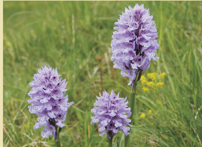
Hochblüte Anfang - Mitte Mai

Der 20-50 Blüten umfassende Blütenstand ist zunächst kegelförmig, dann halbkugelig und erreicht im Laufe der Aufblühphase eine walzenförmige Gestalt. Die Einzelblüten sitzen in der Achsel häufig zugespitzter Tragblätter, die etwa so lang wie die Fruchtknoten sind. Sie tragen einen geschlossenen Helm von oftmals auch verwachsenen Kelch- und Kronblättern. Diese sind außen hellrosa bis violettrosa gefärbt mit einer dunkel gefärbten Nervatur. Die Blütenlippe ist deutlich dreigeteilt.