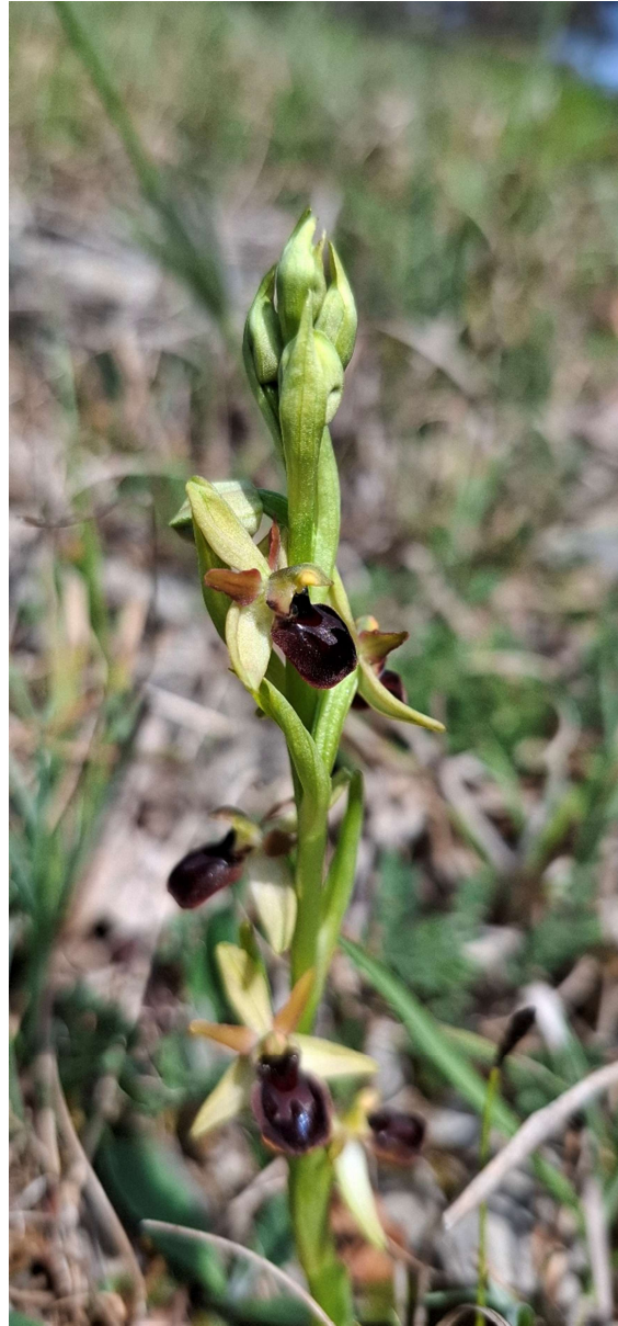
Ophrys sphegodes , Spinnenragwurz

Mit freundlichen Grüßen im Namen des gesamten Vorstandes