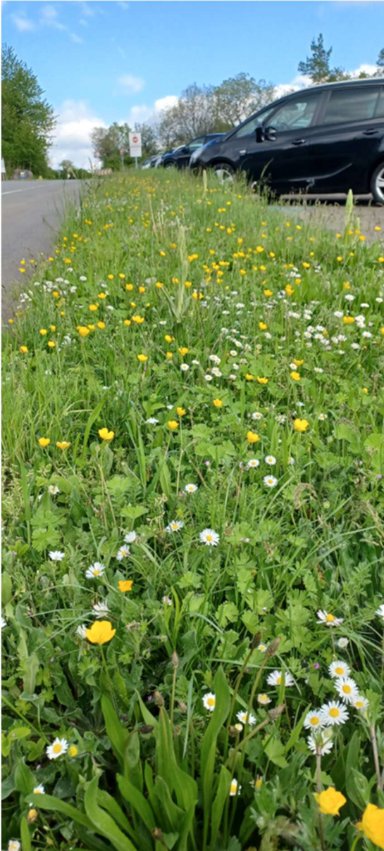
Himantogl. hircinum , Riemenzunge