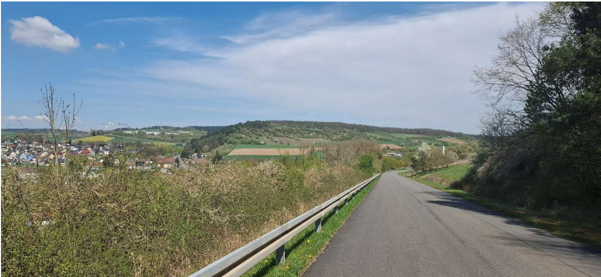
Blick auf den Schmalberg vom Wurmberg aus

Die trockenwarmen Hänge um Hardheim weisen noch Lücken in der Kartierung auf. Zu erwarten sind die auch aus dem benachbarten Taubergebiet bekannten Orchideen-Arten. Jedoch könnte sich noch die eine oder andere weitere Art auffinden lassen.