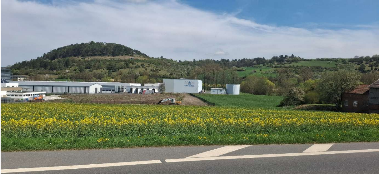
Ansicht des Wurmbergs bei Hardheim