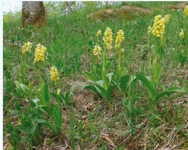
Orchis pallens im Lebensraum, Schopfloch (Schwäbische Alb), 12.05.2006

Das Bleiche Knabenkraut ist eine Pflanze, die eine bestimmte Menge an Licht braucht. Wenn wachsende Bäume und Sträucher zuviel Schatten werfen, stellt die Orchidee ihr Wachstum und ihre Blühfreudigkeit ein. Große Wildschweinrotten durchwühlen gerne die Böden, die Knollen sind für sie ein Leckerbissen. Das Rehwild bevorzugt die Pflanzenknospen und Blüten. Eine große Gefahr stellt der Mensch dar. Ausgrabungen haben schon ganze Standorte zerstört – auch unbedachte forstliche Maßnahmen wirkten sich negativ auf die wenigen Standorte aus.