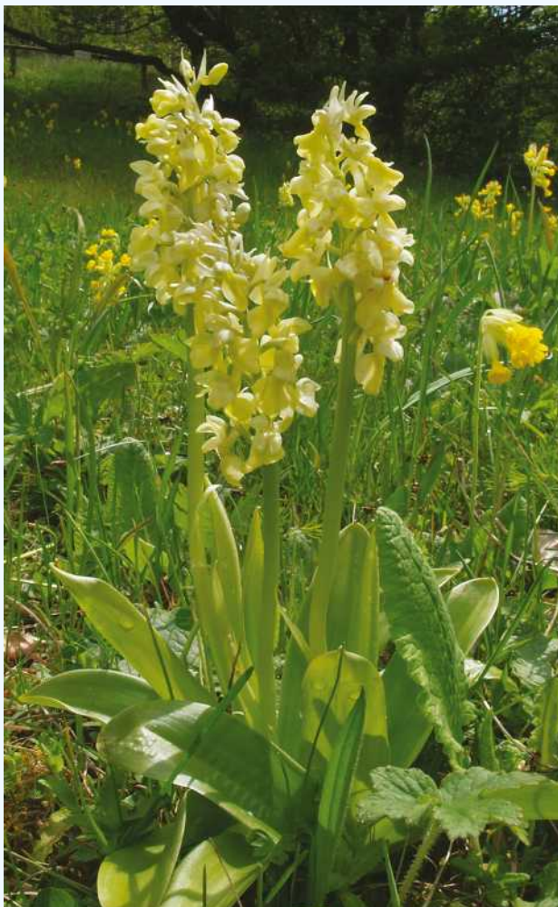
Orchis pallens im Lebensraum, Schopfloch (Schwäbische Alb), 16.05.2010

Orchis pallens fühlt sich in mäßig warmen halbschattigen Laub- und Tannenwäldern wohl. Zu finden ist die Orchidee auch in Wäldern mit Buchen und Eichen sowie in sonnigen Schluchtwäldern. Die Böden sollten frisch (nicht zu trocken) und neutral bis basenreich sein. Lockere Lehm- und Tonböden werden als Grundlage bevorzugt.