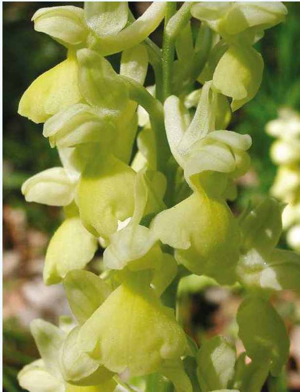
Ausschnitt aus einem Blütenstand von Orchis pallens, Ringgau, 25.04.2011

Die Arbeitskreise Heimischer Orchideen in Deutschland haben das Bleiche Knabenkraut ( Orchis pallens ) zur Orchidee des Jahres 2012 gewählt. Die im Naturschutz tätigen Mitglieder der deutschlandweit aktiven Vereine möchten mit dieser Wahl auf die Gefährdung dieser Pflanzenart und ihrer Lebensräume aufmerksam machen.