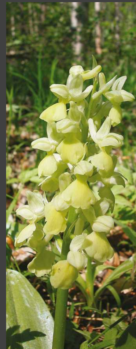
Bleichs Knabenkraut Orchis pallens L.